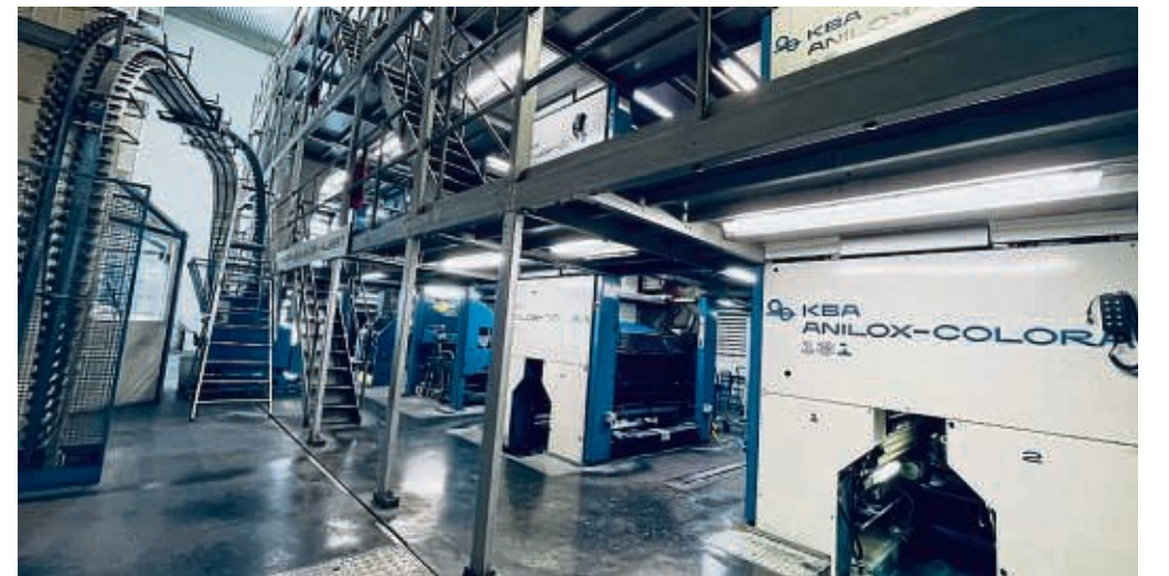
Auch wenn sie wie geleckert aussieht: Die Tage der KBA Anilox-Colora sind gezählt.

Nein, wenn wir ausgedruckt haben, wird die hier aufwendig abgebaut und geht nach Kassel. Dort werden dann die „Zeit“ und die „FAZ“ gedruckt.