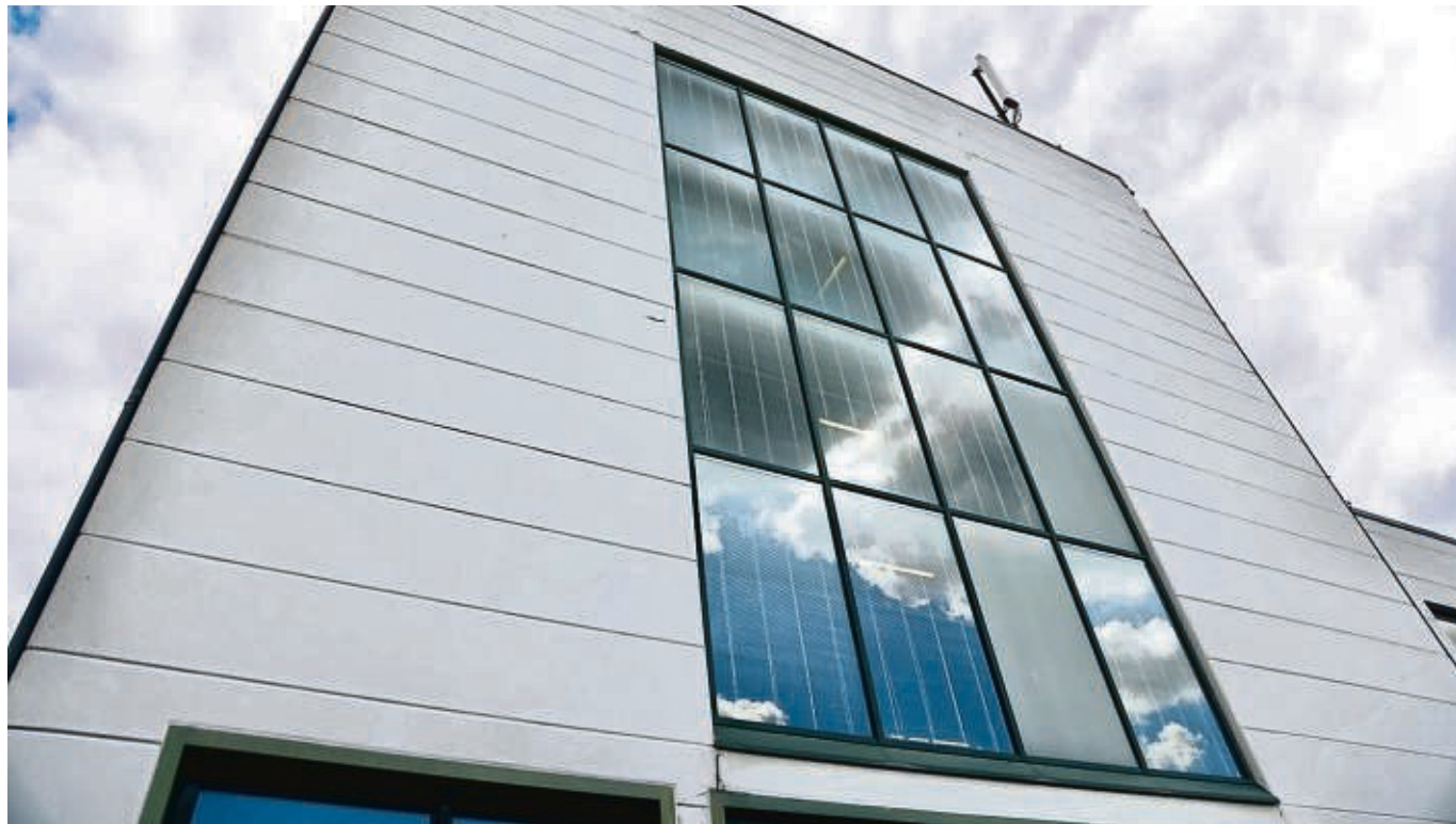
Das Redaktions- und Druckhaus mit Rotation in Syke. Die große Fensterfront wird im Zuge des Einbaus herausgenommen; durch die Öffnung erfolgt das Einbringen der neuen Druckmaschine.

Die erste Idee war, dass wir diese Maschine ins „Druckhaus Bild“ stellen (eine große Halle mit einer Druckmaschine, auf der bis vor Kurzem in Syke die Bild-Zeitung gedruckt wurde, Anm. d. Red.). Die kommt weg, dann setzen wir die neue da drauf. Die neue Maschine wird aber deutlich kleiner sein – dann haben wir eine kleine Maschine in einem Riesendruckhaus und müssen das über die nächsten 10, 15 Jahre energetisch versorgen. Das derzeitige Druckhaus können wir aber nicht energetisch abhängen. Wir